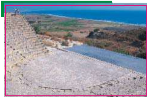
Αρχαίο Θέατρο Κουρίου

Σύμφωνα με τη Συνθήκη Ζυρίχης-Λονδίνου, η Κύπρος γίνεται ανεξάρτητη δημοκρατία στις 16 Αυγούστου 1960.