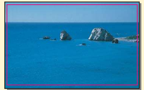
Η Πέτρα του Ρωμιού

Από την Πάφο ξεκίνησε επίσημα και ο Χριστιανισμός στο νησί το 45 μ.Χ. όπου οι απόστολοι Παύλος και Βαρνάβας, ιδρυτές της Εκκλησίας της Κύπρου, άρχισαν να διδάσκουν τη νέα θρησκεία. Ο ανθύπατος της Κύπρου Σέργιος Παύλος ασπάζεται το Χριστιανισμό και η Κύπρος γίνεται η πρώτη ρωμαϊκή επαρχία με χριστιανό διοικητή.