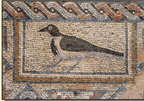
Τα ψηφιδωτά της Πάφου

χρόνων ανασκαφές. Περιλαμβάνουν θαυμάσια ψηφιδωτά πατώματα που θεωρούνται από τα ωραιότερα της Ανατολικής Μεσογείου. Οι σκηνές είναι κυρίως παρμένες από την ελληνική μυθολογία και είναι αριστουργηματικές στην εκτέλεση τους.