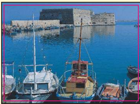
Το Μεσαιωνικό κάστρο

Το Μεσαιωνικό κάστρο που αρχικά κτίστηκε σαν Βυζαντινό οχυρό για να προστατεύει το λιμάνι. Ξανακτίστηκε από τους Λουζινιανούς τον 13 ο αιώνα αλλά οι Ενετοί το κατεδάφισαν το 1570, επειδή δεν μπορούσαν να το υπερασπιστούν εναντίον των Τούρκων, οι οποίοι με τη σειρά τους το ξανάκτισαν και το ενίσχυσαν όταν κατέλαβαν το νησί.