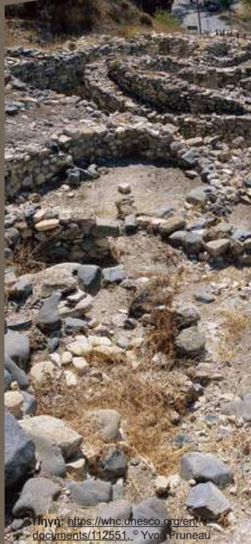
Πηγή: https://whc.unesco.org/en/documents/112551 . ©Yvon Truneau